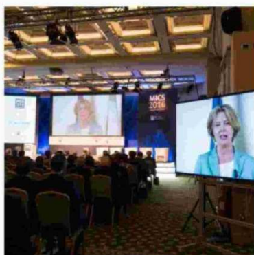
L'intervento della ministra della Salute Beatrice Lorenzin al Mics 2016

NEL MONDO il 25% delle valvole mitraliche che vengono sostituite potrebbero essere riparate. E' uno dei dati emersi durante il Mics 2016, congresso internazionale di cardiologia che si è concluso oggi a Roma. Le valvulopatie mitraliche sono patologie che impediscono il corretto funzionamento della valvola situata tra l'atrio e il ventricolo sinistro del cuore. Si parla d'insufficienza mitralica nel caso in cui la valvola non riesce a chiudersi correttamente e il sangue invece di proseguire il suo cammino verso l'aorta procede in senso contrario; mentre la stenosi è la conseguenza di un eccessivo restringimento dell'orifizio (apertura) valvolare.